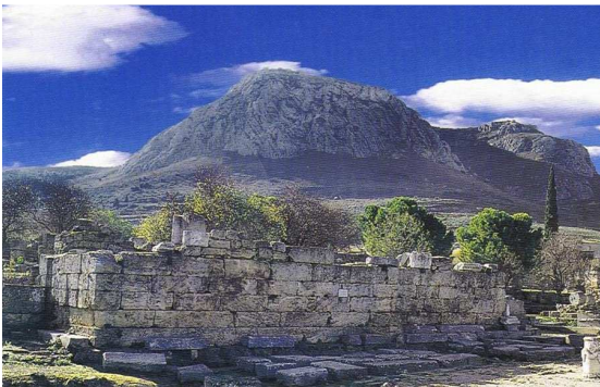
A korinthosi béma maradványa, ahonnan Szent Pál szólt a korintosziakhoz

Korinthosba a magyar tervek alapján készült csatornán keresztül értünk. Szent Pál Athénből jött Korinthosba, a Római Birodalom egyik legnagyobb városába, ahol zsidók és görögök sokasága tért meg, köztük a zsinagóga feje és egész háznépe. Egy éjszakai látomásban Jézus Krisztus Pált további korinthosbéli prédikálásra bátorította, ezért egy évig élt a városban.