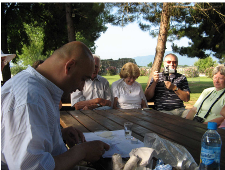
Szentmise Philippi árnyas fái alatt, mókusok és madarak társaságában

Érdemes felidézni a híres 'szeretet himnuszt', amely az élet és egyben a hit alapjáról beszél, és amelyet ugyancsak érdemes akárhányszor ismételni: