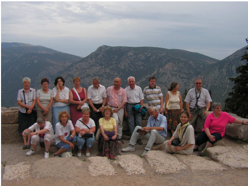
A majdnem teljes zarándokcsapat

Szent Pál vált a krisztuskövetők hitének legnagyobb terjesztőjévé. Lankadatlanul járta a Földközi tenger vidékét, térített, keresztelt, csodás gyógyításokat hajtott végre Krisztus erejével.