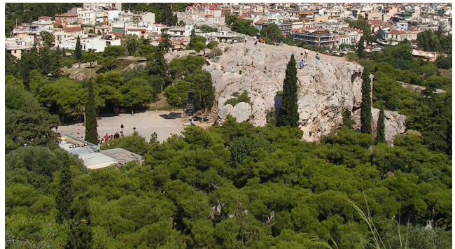
Az Aeropagus - szikla

Felmásztunk a Mars-hegyre (Areopagus), ami valójában egy hatalmas szikla, ahol Szent Pál elmondta prédikációját.