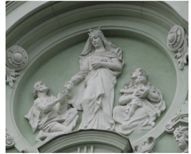
Szent Erzsébet élelmet oszt Egy kassai ház homlokzata