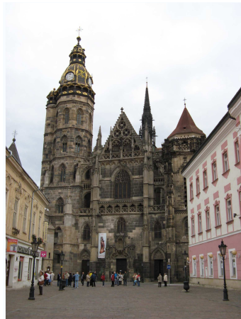
A Szent Erzsébet székesegyház

Maga a dóm külső látványával is megkapó, de belsejének kialakítása, a gótikus oltárok, oltárképek, a máshol ritkán látható belső építészeti részletek mind nagy élményt jelentettek.