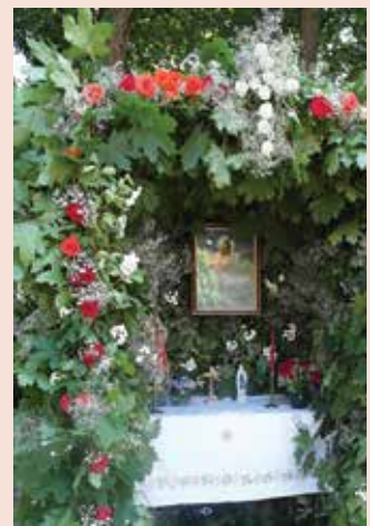
Úrnapja, az oltáriszentség ünnepe – az idej sátrak