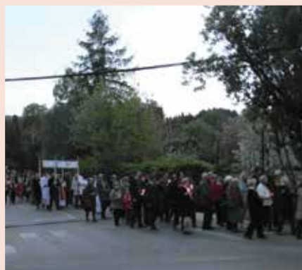
Nagyszombat, Feltámadási körmenet