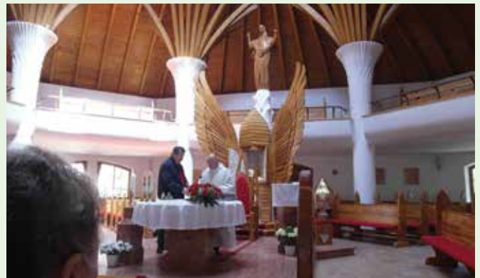
Szentmise a csíkszeredai un. Makovecz templomban

Csíkszereda után a Nyerges tetőre mentünk, a haláláig harcoló majd 200 székely harcos emlékére állított számtalan kopjafa, kereszt, emléktábla közé. 1849-ben több napig álltak ellent az orosz-osztrák sokszoros túlerőnek, de nem adták meg magukat, árulás okozta vesztüket. Kányádi Sándor versével emlékeztünk mi is a hősekre.