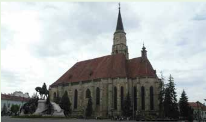
Szent Mihály templom, Kolozsvár

Másnapi kirándulásunk első pontja volt az Erdély-szerte feltörő borvíz megízlése, majd megáll a Tolvajos tetőn lévő keresztelnél, amelyek a magyarság és a csíkiek katolikus hitének megmaradására emlékeztetnek. Csíkszeredán mindenkit lenyűgözött a Makovecz Imre által tervezett Millenniumi templom belső képe a sok fényvel, a virágokat mintázó oszlopokkal, az életet jelképező sok fa, az ember tekintetét felfelé emelő gerendázat.