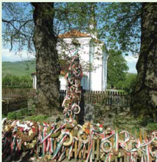
Tamási Áron sírja

során Londontól Isztanbulig, Jersey szigetétől Egyiptomig és a Szentföldre is eljutott, míg 1859-től már a Székelyföldet járta, kutatta annak minden szegletét. Ennek eredménye lett a hatkötetes mű, A Székelyföld leírása történelmi, régészeti, természetrajzi s népművészeti szempontból. Sírja elé székelykapu-sort állítottak, amelyből az utolsó kapu az övé volt.