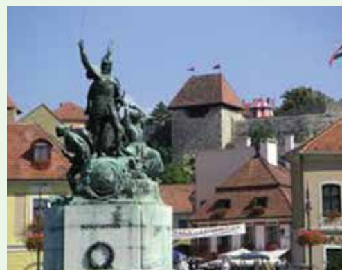
Az egri Dobó szobor háttérben a várral

A részvételi díj legkésőbb augusztus 27-ig (vasárnap) esedékes!