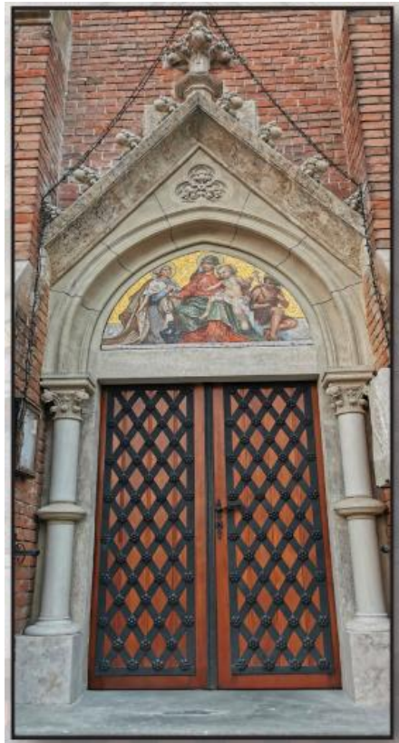
...és ilyen lett