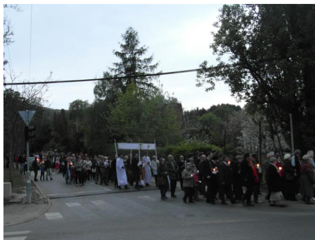
Húsvéti keresztút és körmenet Leányfalun