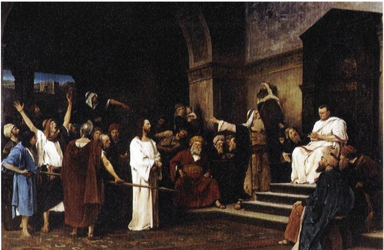
Munkácsy Mihály: Krisztus Pilátus előtt

Pilátus ezt mondta: „Mi az igazság?” E szavakkal újra kiment a zsidókhoz, és kijelentette: „Én nem találok semmiben bűnösnek.”