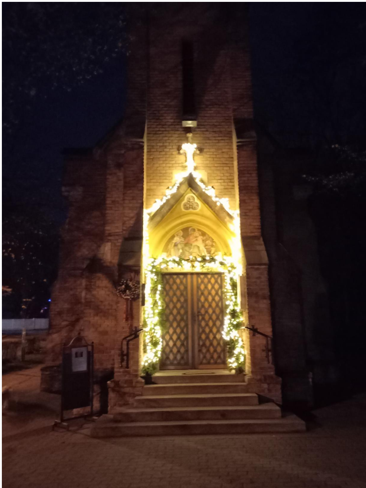
A templom bejárata karácsonyi díszben