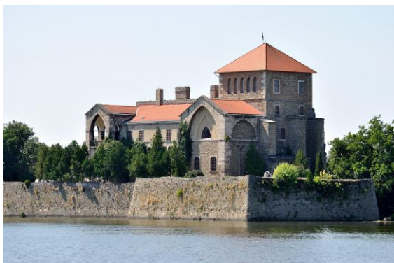
A tatabányai vár

A Thermal Hotelben találtunk a csoport számának megfelelő szobaszámot, ráadásul még fürdőbelépő is járt a csomaghoz. A környezet nem volt osztályon felüli, de a célnak tökéletesen megfelelt.