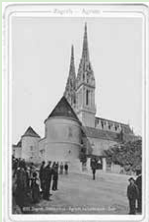
A Zágrábi Szent István katedrális

Szent László királyunk alapította 1090 körül a zágrábi püspökséget, akkor indult meg a város fejlődése. IV. Béla királyunk ide menekült először a tatárok elől, majd a tatárok elvonulása után ő adott szabad királyi városi rangot, innentől volt a város a horvát bán székhelye. Érdeemes