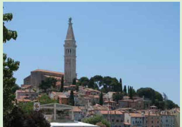
Rovinj, Szent Eufémia templom

lesz tehát figyelemmel járni a várost, sok magyar emlékekkel találkozhatunk. Igaz, ezek mindig közös emlékek, nem választható szét a magyar és a horvát nép történelme.