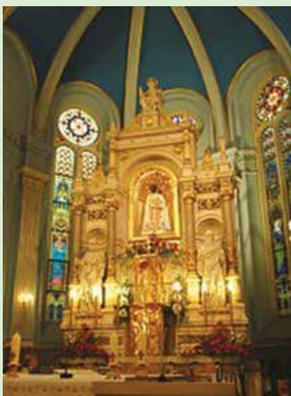
Máriabeszerce, főoltár a kegszoborral

lesz tehát figyelemmel járni a várost, sok magyar emlékekkel találkozhatunk. Igaz, ezek mindig közös emlékek, nem választható szét a magyar és a horvát nép történelme.