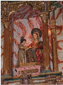
Szent Anna (Andalúzia)

Leányfalu – tudjuk jól – korábban Pócsmegyer 'leánya' volt. Ahogy régen mondták – annak idején ez kölcsönös csúfolódás volt – Pócsmegyeren laktak a 'kálomisták' (reformátusok), Leányfalun pedig a 'pápiszták' (katolikusok). Mára – hál' Istennek – már nagyon jól együtt él Leányfalun is a két keresztény felekezet.