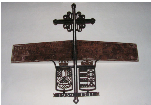
Ezen évek emléke a Szent Anna templomban