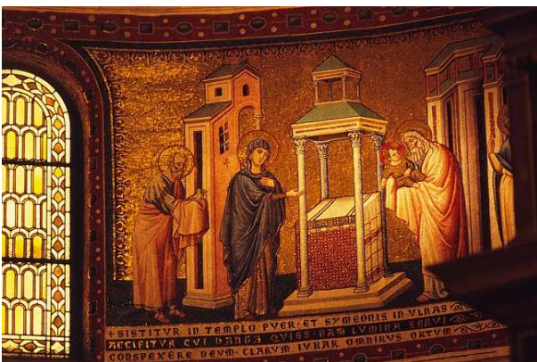
Santa Maria in Trastevere – Jézust bemutatják a templomban (mozaikkép)