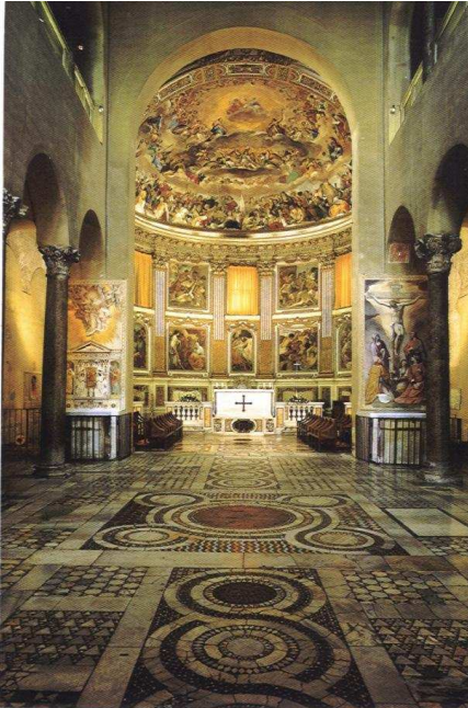
Santi Quattro Coronati - bazilika (A négy megtért pannóniai kőfaragót tüzes koronával koronázták meg)

A lelki élménytől! Ebből a szempontból a római út legnagyobb lelki élményét nem is Róma, hanem Assisi adta. Assisi, illetve Szent Ferenc, akinek lelke szentelte meg a várost. Leginkább hatott ez ránk a Szent kis kápolnájában, amit óriási székesegyházban óvnak és sírhelyén, ahol mindenki döbönt némaságban hagyja hatni magára a szent áhítatot. Ezeken a helyeken mindenkiben megszűnik a turista, a nézelődő, az ismeretszerző és egyszerűen csak hívő emberként van jelen, aki megérzi Szent Ferenc hitének máig ható, hatalmas erejét.