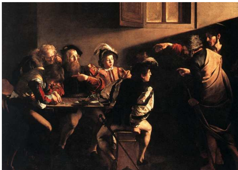
Caravaggio: Máté elhívása