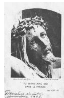
De victus vincit – legyőzöttség győz

"A képet az Andrássy útra is magammal viszem. A börtönben is velem van. Hogyan maradt meg? -Nem tudom- A tárgyalás napjaiban is ott van és titokban rá-ránézek. Amikor a fegyházban misézni engedtek, ez az oltárképem. A házi őrizetben is ott áll az asztalon előttem. A szabadságharcosok jöttével is ezt veszem először magamhoz 1956-ban. Az amerikai követségen is ennek a "legyőzött győző" Krisztusnak a képe előtt misézek. Oda is a ruhám alatt, a keblemen őrizve vittem magammal.- Azóta is velem van. Állandóan magamnál hordom. A felirat fele, a legyőzöttség rajtam is és az én életemben is megtörtént. De az állítmány, a 'vincit...' Isten kezében van."