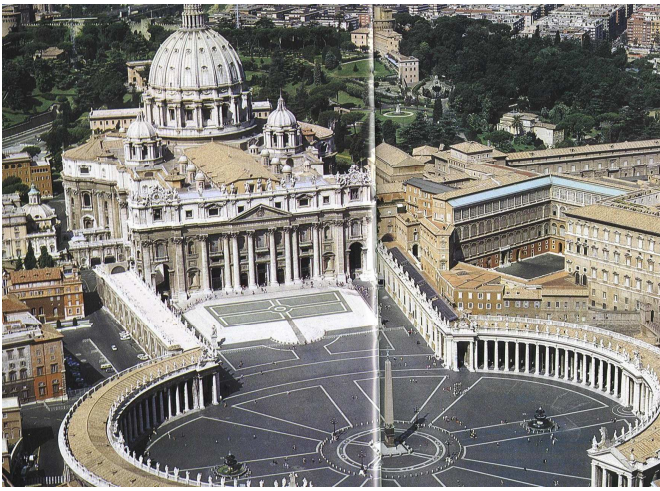
Szent Péter bazilika

Carafa kápolnájában Filippino Lippi képei mutatják az egyháztanító Aqinói Szent Tamás életének eseményeit. A főoltárban Sienai Szent Katalin nyugszik, jobbra Michelangelo Feltámadt Krisztus szobra és itt nyugszik Fra Beato Angelico festőseni, domonkos rendi szerzetes. Utunk innen a San Ignazio di Loyola templomba vezetett, ahol a híres Pozzo szerzetes perspektívikus festményeit csodáltuk meg.