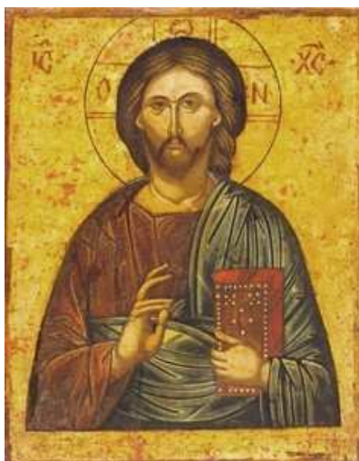
XVI. századi görög ikon – Esztergomi Keresztény Múzeum

A tanító Krisztus: Ez a tanítás nem elvont igazságok gyűjteménye, hanem Isten eleven misztériumának közlése. Mert Krisztus, aki az evangéliumban tanít, messze több, mint Izrael 'tanítói' és azok tanítása, mégpedig azon különleges kapcsolat miatt, amelyet Krisztus személye, szavai és tettei között láthatunk. Az evangéliumokból ugyanis nyilvánvaló, hogy Jézus 'tanított'. De nemcsak tanított, hanem 'tanított és cselekedett'. E két szóval, amelyekkel az Apostolok Cselekedetei kezdődik, Szent Lukács összekapcsolja és ugyanakkor szétválasztja Krisztus küldetésének e két kiemelkedő vonását.