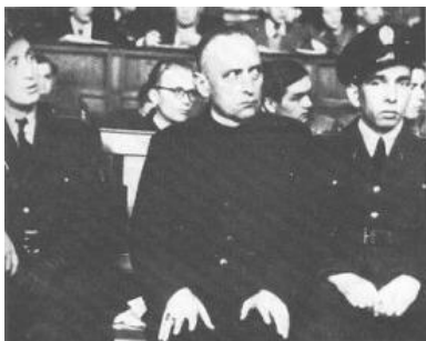
Mindszenty hercegprímás vádlottként a 'demokratikus' bíróság előtt

Az 56-os forradalomra és szabadságharcra emlékezve a magam részéről rendkívül fájdalom, és szinte érthetetlennek tartom, hogy nemcsak a magyar Katolikus Egyháznak, de a magyar forradalom időszakának legnagyobbjai közé számító Mindszenty József hercegprímás még ma sem kapta meg azt a tiszteletet és megbecsülést, amit legalább boldoggá avatásával kiérdemelne. Az ő hosszú éveken át tartó szenvedése példamutató, amikor a forradalom 50. évfordulójára emlékezünk, Őt mindenkor a forradalom és az azt követő időszak legkiemelkedőbb személyiségei között kell említeni.