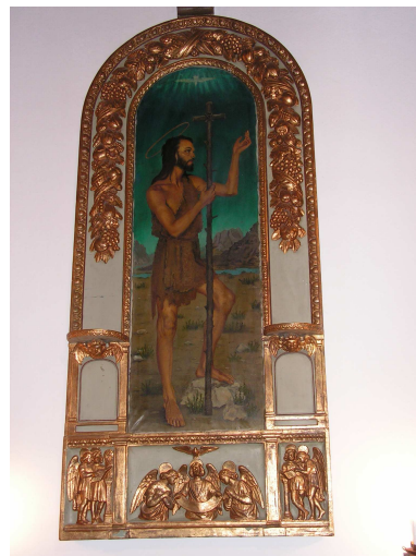
Keresztelő Szent János

Ezzel a szülők kívánsága teljesült, megtörtént a találkozás Isten és a gyermek között a hívek közösségének közvetítésével.