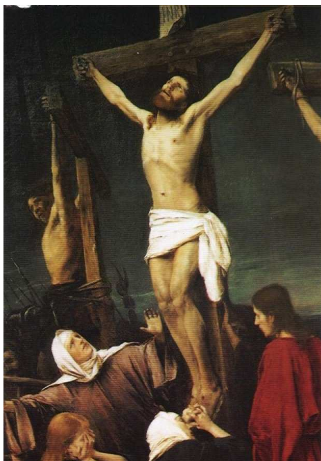
Munkácsy Mihály: Golgota - részlet

Húsvét, az ünnepek ünnepe! Nekünk, hívő embereknek az életünk reménye, hogy van örök Igazság, aki maga az Isten. Így nem kell félnünk a mától, holnaptól, bármennyire is elszomorító a mindennapi közélet.