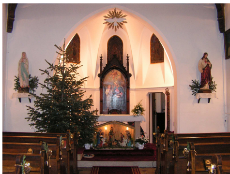
Feldíszített templomunk tavaly Karácsonykor

Emberré lett az Úr, szalmán kapott helyet, Hogy széna – szalma én már soha ne legyek. Alázat s gyermeki lélek mily szent dolog! Kik látták az Urat elsőnek? – Pásztorok. Azt mondd, hogy a Nagy kicsinnyé nem lehet, S a porszem képtelen felfogni az eget? Nézd a Szűz Gyermekeit! Ezt a bölcsőt tekintsed, Benne a föld s az ég és száz világ pihent meg. Bizony a szíved is kicsi jászol ha lenne, Újra jönne az Úr s Gyermekként megszületne. Ha Krisztus százszor is születne Betlehemben, Elvesznél, ha nem jönne a szívedben.