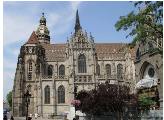
Szent Erzsébet dóm - Kassa

Kassa legnagyobb műemléke az Árpádházi Szent Erzsébet tiszteletére szentelt Szent Erzsébet dóm. A dóm altemplomában temették el 1906-ban a Rodostóból hazahozott II. Rákóczi Ferenc fejedelem hamvait.