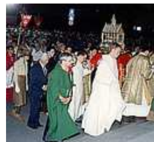
Szent Jobb körmenet augusztus 20.-án a budapesti Szent István bazilikánál

Mindezek mellett a testi pihenés is elengedhetetlen, legyen az üdögélés a vízparton, társas kirándulás, városnézés, vagy baráti együttlét, esti beszélgetések a szabadban, vagy sport, elsősorban társas sportok.