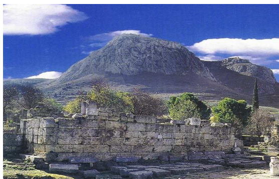
A korinthosi béma maradványa, ahonnan Szent Pál szólt a korintoshiakhoz

A görög idők romjainak megtekintése Delphiben, de máshol is – az ismeretszerzésen, az álmélgodáson túl – abban segített a zarándoklat résztvevőinek, hogy az akkori életkörülmények, az akkori környezet megismerésével felidézhezzük: Szent Pál is ilyen környezetben járt ezen a vidéken, ilyen életkörülmények közti embereknek igyekezett átadni a krisztusi hitet.