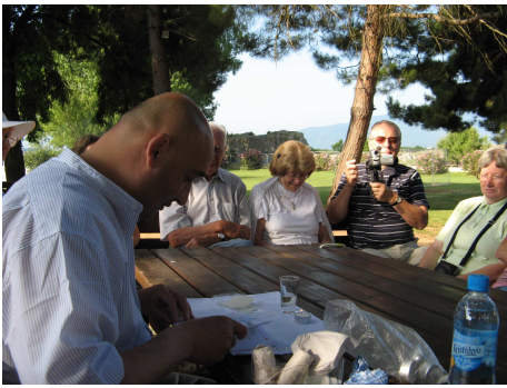
Szentmise Philippi árnyas fái alatt, mókusok és madarak társaságában

'Testvéreim! Törekedjete a legértékesebb kegyelmi ajándékokra! Most ezért egy mindennél magasztosabb utat mutatok nektek. Beszéljek bár különféle nyelveken, szóljak akár az angyalok nyelvén: ha szeretet nincs bennem, csak zengő érc és pengő cimbalom vagyok. Tudjam bár csodálatosan hirdetni az Isten igéjét, ismerjek bár minden titkot és minden tudományt, legyen bár olyan erős hitem, hogy megmozgassa a hegyeket: ha szeretet nincs bennem, semmi vagyok. Osszam szét bár egész vagyonomat, sőt vessem oda testemet is úgy, hogy elégjek: ha szeretet nincs bennem, mit sem használ nekem. A szeretet türelmes, a szeretet jóságos. A szeretet nem féltékeny. Nem kérkedik, nem gőgösködik. Nem kihívó, nem keresi a maga igazát. Haragra nem gerjed, a sértést nem tartja számon. Nem örül a gonoszságnak, hanem örül az igazság győzelmének. Mindent eltűr, mindent remél, mindent elvisel. A szeretet nem szűnik meg sohasem.'