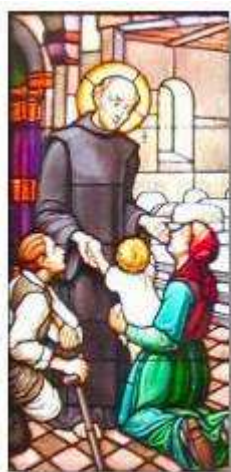
Istenes Szent János

Egyre több ifjú ember jelentkezik, széles körben válik ismertté Istenes János tevékenysége, szent életének híre. A központ ugyan Granada, de az irgalmasság munkája elterjed az egész országban.