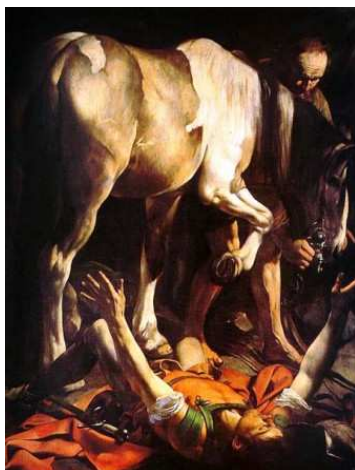
Caravaggio: Szent Pál megtérése (Róma, Santa Maria del Poppolo)

Saul még mindig lihegett a dühtől, és halállal fenyegette az Úr tanítványait. Elment a főpaphoz, s arra kérte, adjon neki ajánlólevelet a damaszkuszi zsinagógához, hogy ha talál ott embereket, férfiakat vagy nőket, akik ezt az utat követik, megkötözve Jeruzsálembe hurcolhassa őket. Már Damaszkusz közelében járt, amikor az égből egyszerre nagy fényesség ragyogta körül. Földre hullott, és hallotta, hogy egy hang így szól hozzá: 'Saul, Saul, miért üldözöl engem?' Erre megkérdezte: 'Ki vagy, Uram?' Az folytatta: 'Én vagyok Jézus, akit te üldözöl. De állj fel és menj a városba, ott majd megmondják neked, mit kell tenned.'