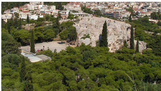
Az Aeropagus - szikla

Felmásztunk a Mars-hegyre (Areopagus), ami valójában egy hatalmas szikla, ahol Szent Pál elmondta prédikációját.