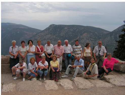
A majdnem teljes zárandokcsapat

Szent Pál vált a krisztuskövetők hitének legnagyobb terjesztőjévé. Lankadatlanul járta a Földközi tenger vidékét, térített, keresztelt, csodás gyógyításokat hajtott végre Krisztus erejével.