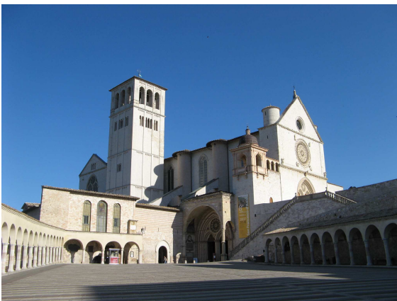
A Szent Ferenc bazilika Assisiben

A zarándok-csapat jó része már nem először látogatott Assisibe. De ez a város mindig nagy élmény. Maguk az ódon utcák, házak terek, templomok is, amelyekre most több idő jutott, mint a római zarándoklat során. Szent Ferenc és Szent Klára lelkülete érződik itt mindenütt, az idelátogatók leginkább miattuk jönnek. Meg akarnak érezni, érteni valamit abból, ami a két szentéletű embert Isten feltétlen szolgálatára bírta, amellyel a természetet, az embereket, mindent szeretettel és Istent dicsőítve szolgáltak.