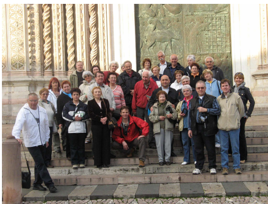
A majdnem teljes zarándokcsapat

Maga dóm is számtalan látnivalót adott azon túl, hogy imádkozhattunk a méltán oly népszerű szent sírjánál kérve és köszönve segítségét.