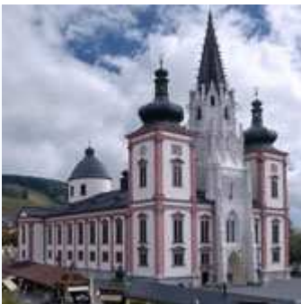
A Bazilika Máriacellben

Alig találunk az egész világon még egy kegyhelyet, amelynek hasonlóan gazdag történelmi háttere volna. A főkapu fölött az 1200-as évszám olvasható. Ez volna tehát a román stílusú kápolna építésének kezdete. III. Frigyes salzburgi érsek búcsús okmánya 1330-ban már sűrűn látogatott kegyhelyként tanúskodik a Celli Boldogasszony templomáról.