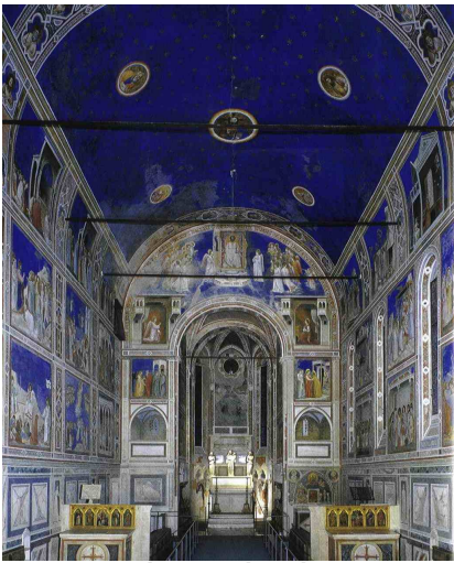
Scrovegni kápolna Pádovában

Külön fénypontja volt az egész útnak a Scrovegni kápolna megtekintése. Egy XIII. századi uzsorás bűneinek kiengeszteléséért emeltette fia a kápolnát, amelyet Giotto freskóival díszített.