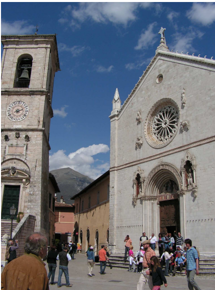
Az ikertestvérek, Szent Benedek és Szent Scolastica temploma Norciában

Casciában meglátogattuk Szent Ritát, aki a templomban található üvegkoporsóban alussza örök álmát. A XV. századi történet, Szent Rita nehéz házasesete, majd szolgálata apácaként máig ható példa, amit érdemes megismerni.