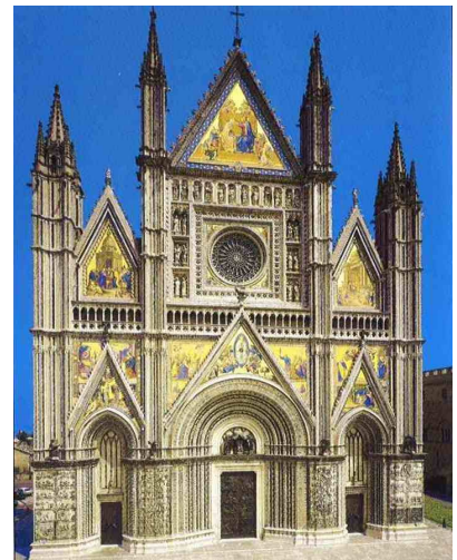
Orvieto - dóm

A dómban, a relikvián kívül, nagyszerű freskókat láthattunk, amelyek a világ végének elképzelt jeleneteit, a pokolra jutottak szenvedéseit, az üdvözültek kitüntetését és a feltámadást mutatják.