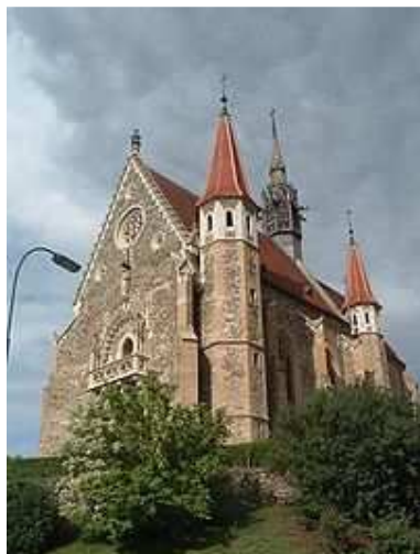
Mária Mennybemenetele templom – Máriafalva

A Batthyány, a Nádasdy és Eszterházy családok nyomait keressük fel ebben a pár napban, de Mária kegyhelyek is lesznek úticéljaink között. Boldog Batthyány Strattmann László sírja, a Batthyány kastély, az Eszterházy vár és kastély, vagy a Boldogasszonyban található bazilika, vagy a máriafalvi Mária Mennybemenetele templom a pécsi Zsolnay gyárban készült főoltárával mind lelki élményt is nyújtanak ismereteink bővítése mellett.