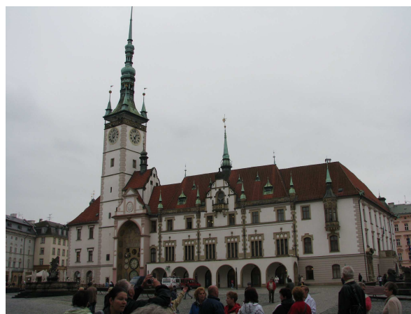
A városháza Olomouc-ban

Ép várakban is bővelkedik Csehországnak morva területe. Sok ilyen vár mellett csak elhaladtunk a busszal, de legalább kívülről megnéztük Bouzov várát, és belülről is végigjártuk Pernštejn várát. Történetük sok szállal kötődik a magyar, de inkább a Monarchia történelméhez.