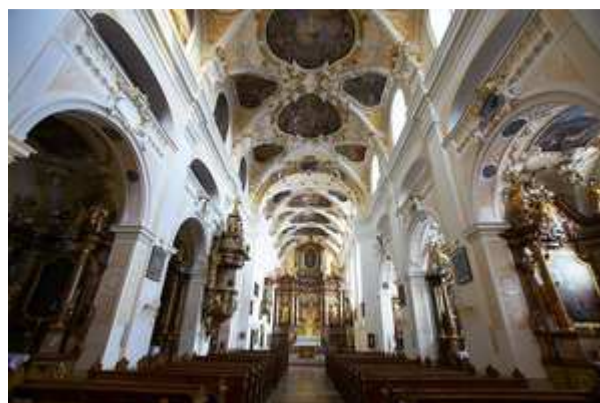
A bazilika belső tere – Boldogasszony

Reggeli – Sopron – Féltorony (Halbturn)/Habsburg kastély – Boldogasszony (Frauenkirchen)/szentmise a székesegyházban – Fertőd/Eszterházy kastély – érkezés Leányfalura az esti órákban.