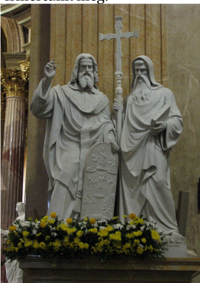
Szent Cirill és Szent Metód a Velehrad-i székesegyházban

Nyitra és Nagyszombat voltak első megállóink. Ezek a valamikor fontos magyar városok ma már teljesen szlovákok, de találkoztunk magyar szóval. Rövid tartózkodásaink arra voltak csak elegendőek, hogy pillantást vessünk a két városra és legfontosabb lelki központjaikra, fő templomaikra.