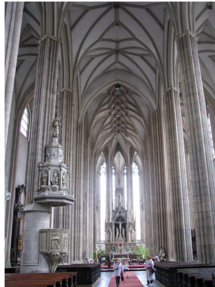
Szent Jakab templom belseje (Brünn)

Olmütz (Olomouc) különösen kellemesen lepett meg bennünket szépségével. Közvélekedésünk szerint több szépséget mutatott, mint Brünn. A város házainak, templomainak képeit nemcsak