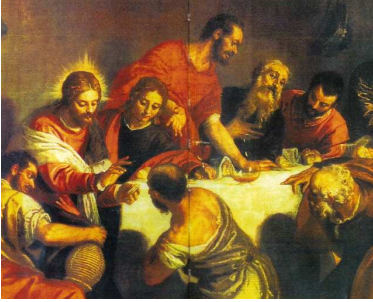
Paolo Veronesi: Utolsó vacsora

„Ti vagytok a föld sója. Ha a só ízét veszti, ugyan mivel sózzák meg? Nem való egyébre, mint hogy kidobják, s az emberek eltapossák. Ti vagytok a világ világossága. A hegyen épült várost nem lehet elrejteni. S ha világot gyűjtanának, nem rejtik a véka alá, hanem a tartóra teszik, hogy mindenkinek világítson a házban. Ugyanígy a ti világosságotok is világítson az embereknek, hogy jótetteiteket látva dicsőítsék mennyei Atyátokat!