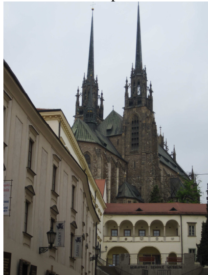
Péter-Pál templom Brünnben