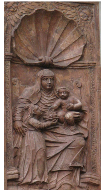
Szent Anna ábrázolás az olmüzi Szent Vencel katedrálisnál

A templomi búcsú a családok, közösségek erősítését szolgálta a régi időkben. Ma sem szabad lemondani a közösség megtartó erejéről. A templomi búcsú ezért olyan alkalom, amikor akár a családok, akár a nagyobb közösség összejövetele serkenti az összetartozást, a nehézségek áthidalásának képességét. A templom, akármilyen felekezethez, egyházhoz is tartozik, a falu közösségének gyűjtőpontja kell, hogy legyen az egész év folyamán, de különösen a búcsú napján. Sok más alkalom, ünnep szólítja, hívja a falu népét találkozásra, de a búcsú kiegészül a közösség és az Isten kapcsolatának néha tudatos, néha kevésbé átérzett emelkedettségével.