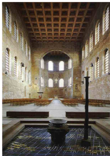
Trier: Konstantin bazilika

Akárhogy is alakították az építészek a minden kornak megfelelően a templomok épületét, mindenképpen úgy kellett alakítaniuk, hogy a szentmise résztvevői teljes odaadással legyenek képesek a közös ünneplésre.