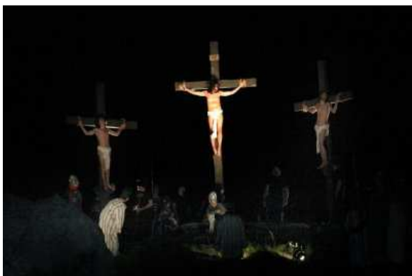
A keresztre feszítés jelenete Budaörsön

Európa sok helyén alakult ki szokás arra, hogy helyi lakosok részvételével eljátszák, bemutassák a passió történetét. Ezek némelyike több évszázados hagyománnyá vált és ma is tömegeket vonz. Hazánkban ilyen a budaörsi passiójáték, Németországban ma már világhírű a tízévenként