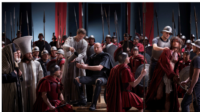
Pilátus kezét mossa az oberammergau-i passió-játékban