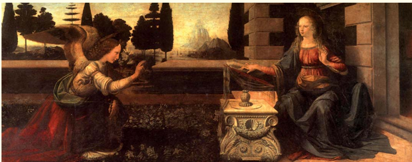
Leonardo da Vinci: Angyali üdvözlés

Mivel már sokan megkísérelték, hogy a köztünk beteljesedett eseményeket leírják, úgy, ahogy ránk maradt azoktól, akik kezdetől fogva szemtanúi és szolgálói voltak az Igének, jónak láttam én is, hogy elejétől kezdve mindennek szorgalmasan utánajárjak, és sorban leírjak neked mindent, tiszteletreméltó Teofil, hogy meggyőződjél róla, mennyire megbízhatók azok a tanok, amelyekre tanítottak.