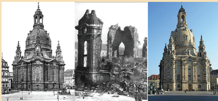
A régvolt, a lerombolt és az újjáépített Frauenkirche Drezdában

A tervek szerint a két utazási napon kívül magára Drezdára szánunk egy teljes napot, egy napot a Szász-Svájc-ra (Königstein, Bad Schandau), egy további napot pedig a Drezdától északnyugati irányba eső látványosságokra (Meißen, Moritzburg, Freiberg) szánunk..