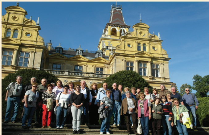
A zarándokcsapat az ókigyósi Wenckheim kastély előtt

Békés olyan tája hazánknak, amelyet különösen sok csapás ért történelme folyamán. A török uralom elmúlásával szinte elnéptelenedett ez a vidék. Egy osztrák 'hadtápos' kapta meg érdemei elismeréseként az óriási területet a 17. században III. Károly királytól. Harruckern György élelmezési hadbiztos a bárói rang mellé kapta majd három vármegye területét. Jó szervező képességének köszönhetően felvidéki szlovákokat és német telepeseket hozott nagy számban azzal, hogy a megélhetésükhöz komoly támogatást adott.