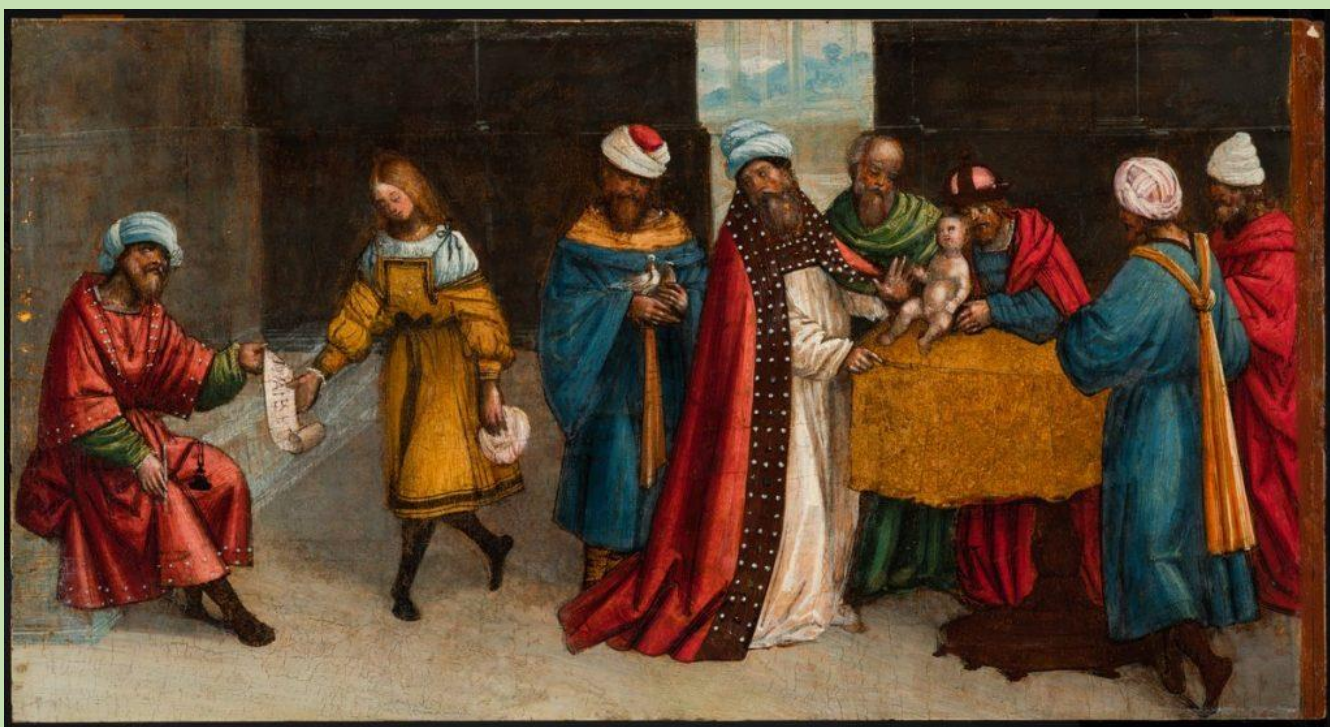
Defendente Ferrari Chivasso: Zakariás nevet ad Keresztelő Szent Jánosnak

Akik csak hallották, szívükbe vésték s mondták: „Vajon mi lesz ebből a gyerekből?” Mert az Úr keze volt vele.