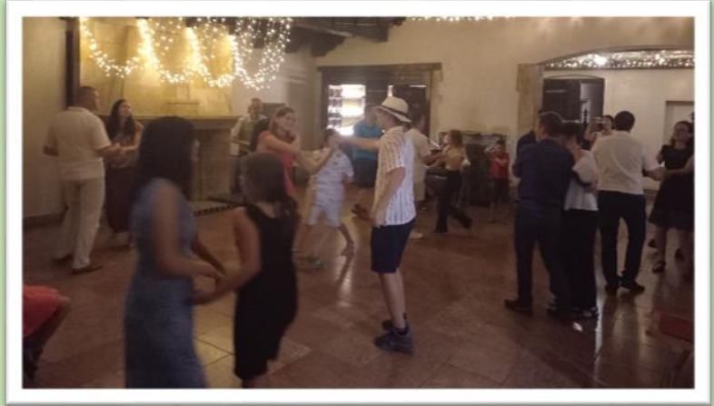
Anna-bál – 2024. július 26.

Keresztény bál: 2024-ben két bálunk is volt. A farsangi keresztény bálunkat február 2-án tartottuk a Faluházban, majd július 25-én, pénteken, az Anna-bál is megvalósult a Sorg-villában. 2025-ben is tervezzük egyházközségünk báljait.