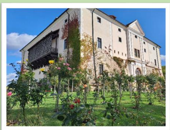
Ozorai Pipó vára

Elköszönve Kaposvártól Ozora felé vettük az irányt, ahol kellemes tárlatvezetéssel megcsodálhattuk Ozorai Pipó pazarul berendezett várát.