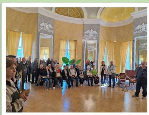
Dég – Festetics-kastély