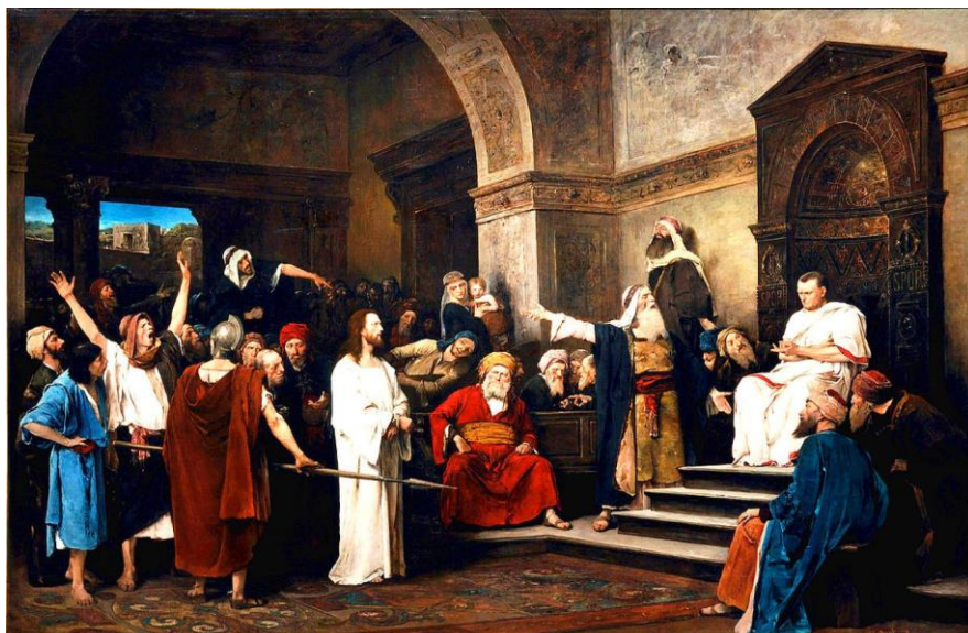
Munkácsy Mihály: Krisztus Pilátus előtt

Mivel álmukban utasítást kaptak, hogy ne menjenek vissza Heródeshez, más úton tértek vissza hazájukba.”